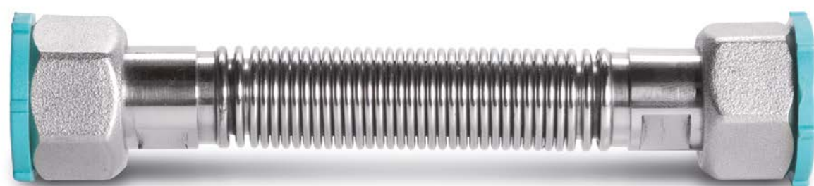
Roztahovací vodovodní hadice Otočná matice G1/2", G3/4", G1". MOP: 0,5 bar.